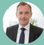
CHRISTOPHE CATOIR Président Adecco Monde